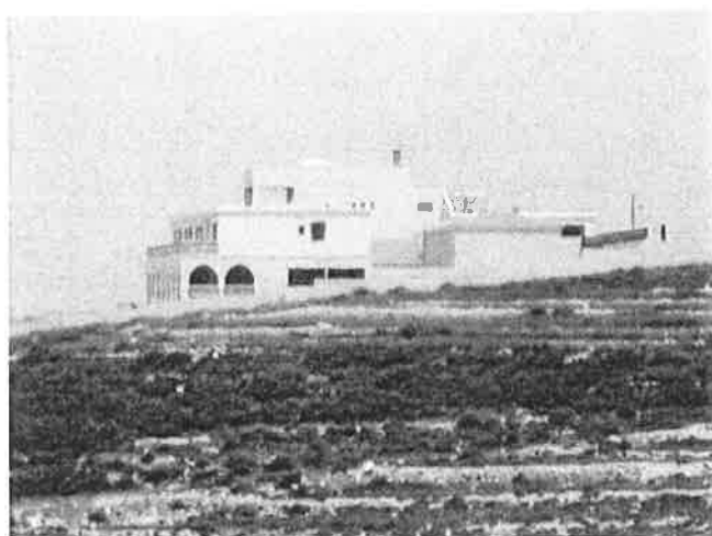
General view of Al Tital building

L'importo ricevuto dal 5 per mille non è stato sufficiente per pagare la totalità della fattura. L'Istituto ha anticipato i fondi necessari per saldarla, a valere su successive raccolte fondi. Il Progetto riguarda i lavori di costruzione di un centro di formazione professionale per la popolazione femminile in area rurale in Libano. Il progetto affronta il notevole deterioramento che si sta verificando nelle zone rurali libanesi, a causa di un impoverimento crescente della popolazione che provoca un esodo di massa verso le città del paese e all'estero. Delle circa 255.000 famiglie che vivono sotto la soglia di povertà estrema, 165.000 appartengono al mondo rurale, quasi il 65% del totale. Opportunità scarse di lavoro, salari relativamente bassi, problemi di sicurezza nella sub-regione, così come inadeguate le aspettative del mercato della formazione sono tutti fattori aggravanti. Le donne sono le prime vittime del peggioramento della situazione socio-economica nelle zone rurali, perché le tradizioni socio-culturali libanesi non incoraggiano la promozione delle loro condizioni. Il centro costruito si dedicherà a rispondere a questa necessità con attività di formazione professionale.